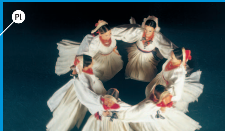
Pl Ansambel narodnih plesova i pjesama Hrvatske LADO profesionalni je folklorni ansambel, osnovan 1949. godine s ciljem istraživanja, prikupljanja, umjetničke obrade i scenskog prikazivanja najljepših primjera bogate hrvatske glazbene i plesne tradicije. http://www.lado.hr