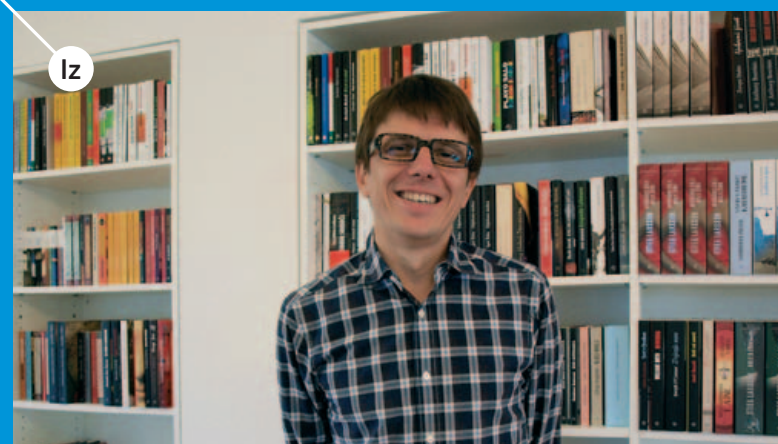
Iz FRAKTURA je nakladnička kuća koja želi i nastoji hrvatskome čitateljstvu ponuditi djela najboljih autora iz cijeloga svijeta. Objavljuje kvalitetnu beletristiku i publicistiku te je danas jedan od najvažnijih nakladnika u Hrvatskoj. http://www.fraktura.hr