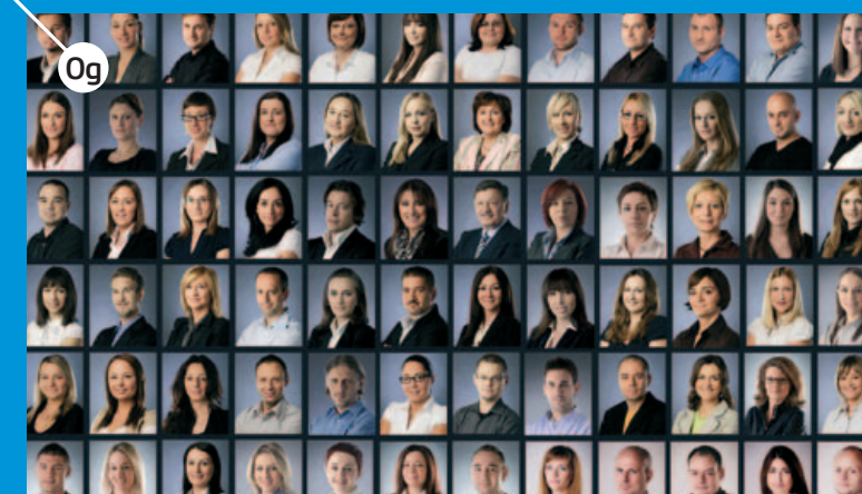
Og UNEX GRUPA agencija je za marketing, oglašavanje i tržišno komuniciranje s nizom dodijeljenih nagrada struke za realizacije u području korporacijskih projekata. http://www.unex.hr