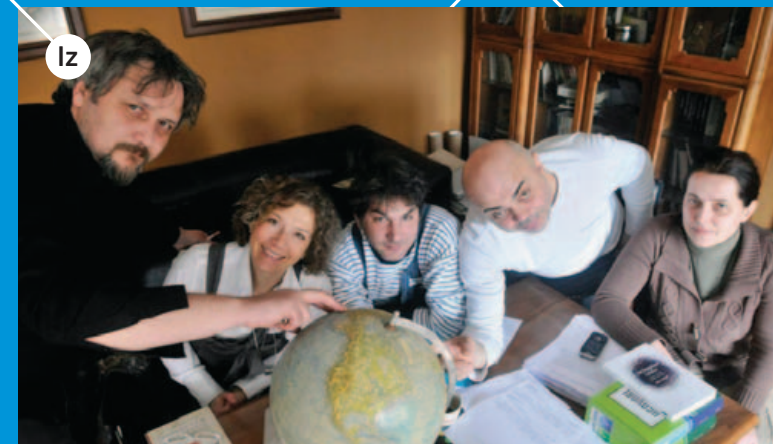
Iz NAKLADA JESENSKI I TURK su izdavačka kuća osnovana s ciljem promicanja čitanja kroz popularizaciju pojedinih područja, tematiziranje društvenih, političkih i kulturalnih pitanja, promociju novih i već etabliranih autora. http://www.jesenski-turk.hr