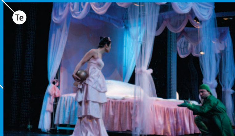
Te KAZALIŠTE TREŠNJA najveće je dječje kazalište u Hrvatskoj i kao takvo ima snažnu i nezamjenjivu ulogu u odrastanju djece. U Trešnji žive svakojaka bića - vile, čarobnjaci i poneki zloduh, ljepotice i zečevi što nestaju... http://www.kazaliste-tresnja.hr