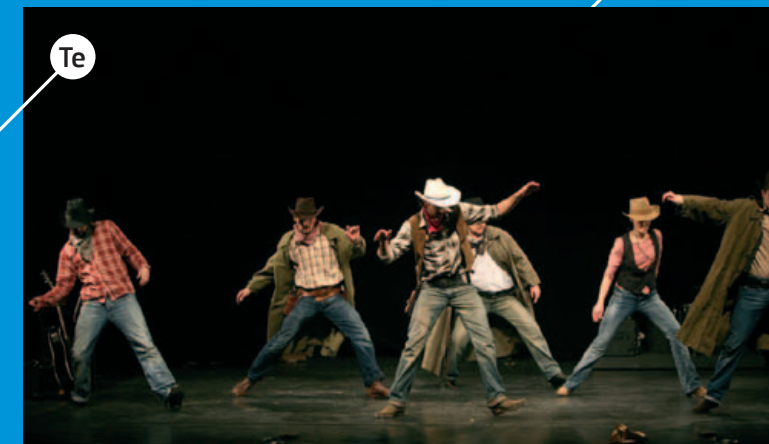
Te TEATAR EXIT je nezavisno, provokativno, inovativno, britko, visokoestetizirano kazalište koje u središte svog stvaralaštva postavlja glumačko umijeće. http://www.teatarexit.hr