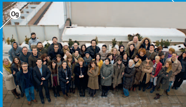
Og MCCANN ZAGREB svakodnevno pokušava probiti granice hrvatskog oglašavanja i pronaći najbolji način za komunikaciju istine o klijentovim brandovima, bez obzira na njihovu veličinu. http://mccann.hr