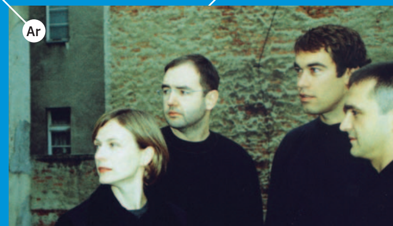
Ar 3LHD je interdisciplinarni arhitektonski ured, zainteresiran za integraciju raznih disciplina; arhitekture, urbanog i pejzažnog krajolika, dizajna, umjetnosti. 3LHD ima integrativni pristup projektima i smatra da osim funkcionalnih, arhitektura mora odgovarati i na mnoga druga pitanja. http://www.3lhd.com