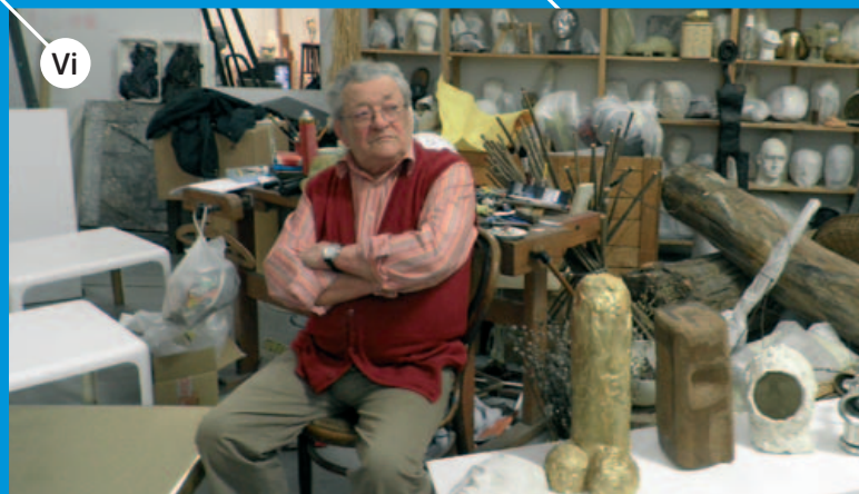
Vi IVAN KOŽARIĆ je najveći živi hrvatski umjetnik koji primarno radi skulpture, no kao izraziti kreativac poznat je po brisanju medijskih i stilskih ograničenja. http://www.msu.hr/#/en/19951

Kakav kulturni i kreativni rad nastaje u Zagrebu? Koji su kulturni i kreativni potencijali Zagreba te kakav utjecaj ostvaruju na prepoznatljivost grada? Postoji li kreativni Zagreb te tko i što ga čini?