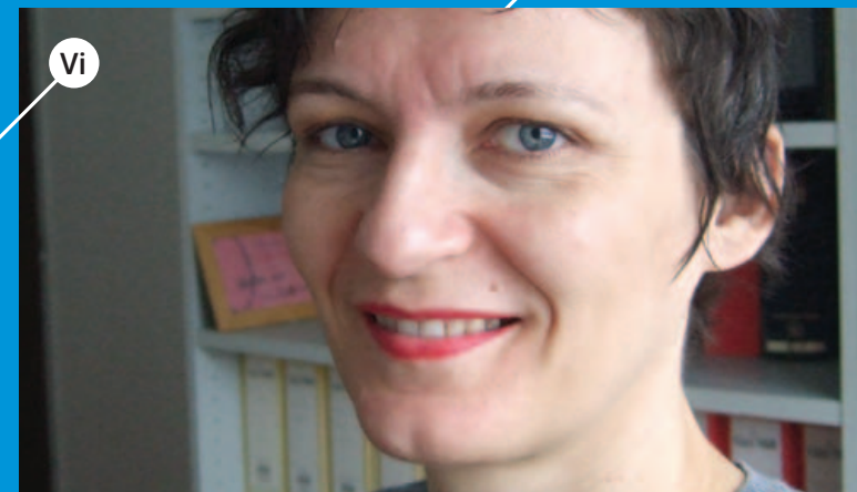
Vi BOŽENA KONČIĆ BADURINA suvremena je hrvatska umjetnica koja, umjesto konvencionalnih postava fizičkih eksponata, najčešće organizira žive izvedbe u galerijskim i drugim prostorima. Riječ je o situacijama koje uključuju interakciju autorice kao izvođačice (performerice) i publike, odnosno publike i od umjetnice angažiranih statista. http://bozenakoncicbadurina.blogspot.com