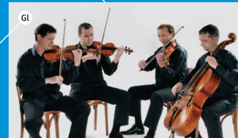
Gl ZAGREBAČKI KVARTET odsvirao je preko 4.000 koncerata na svim kontinentima, snimio više od 60 ploča za razne svjetske izdavačke i radijske kuće. Tijekom devedeset godina djelovanja svoj doprinos Zagrebačkom kvartetu dalo je tridesetak glazbenika. http://www.zagrebquartet.hr