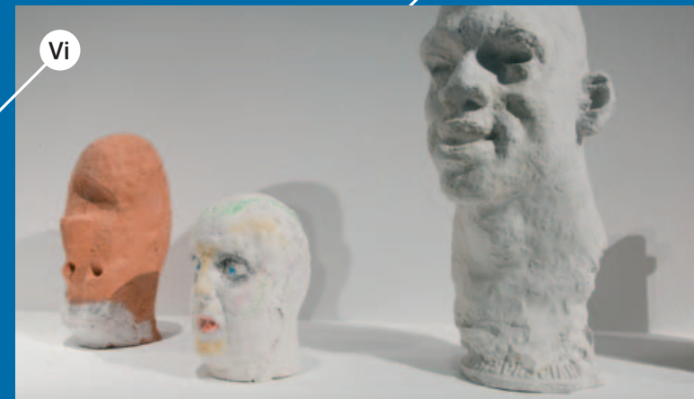
IZ FUNDUSA ATELIJERA KOŽARIĆ, MSU@avenija dubrovnik 17, foto: tomlav šmider, http://www.msu.hr/#/hr/93