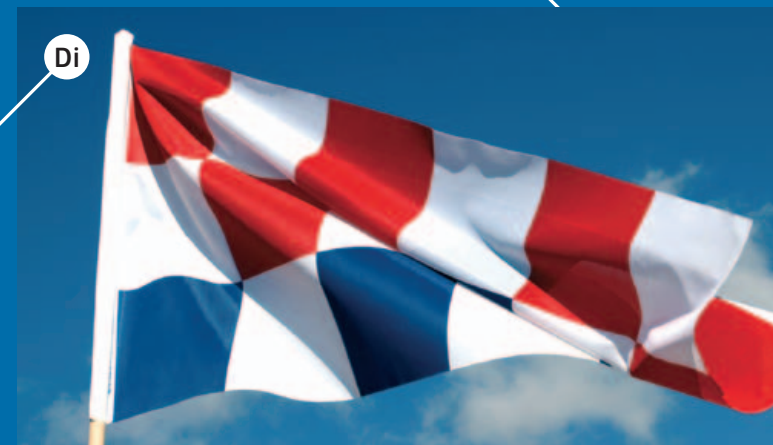
Di ZASTAVA, 1990, autor: boris ljubičić, studio international, http://www.studio-international.com