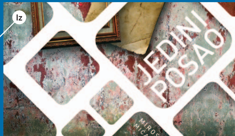
Iz JEDINI POSAO, 2013, autor: miroslav mićanović za meandar, http://meandar.hr