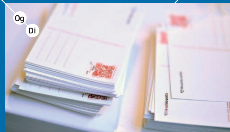
Og Di INTERAKTIVNA POŠTANSKA MARKA, 2011, autori: bruketa&žinić om + brlog, http://bruketa-zinic.com