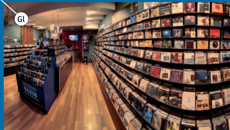
AQUARIUS RECORDS@varšavska 11 i 13, branimirova 29 i maksimirska 16, http://www.aquarius-records.com