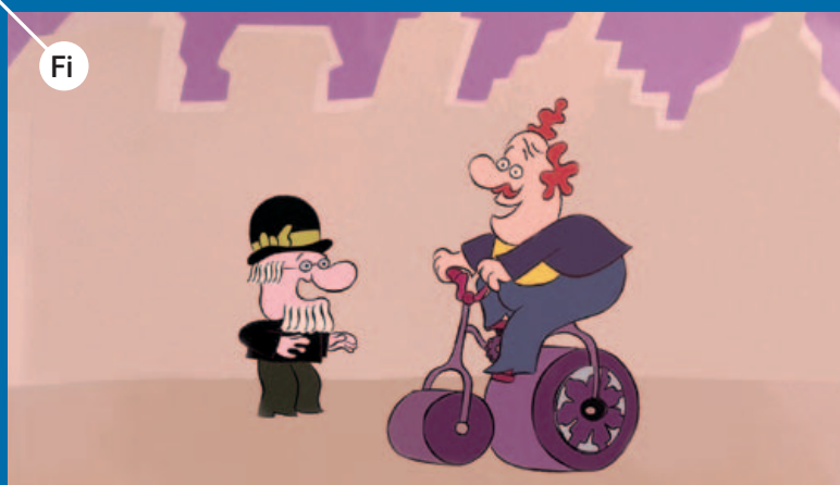
Fi PROFESOR BALTHAZAR, zagreb film, http://www.zagrebfilm.hr