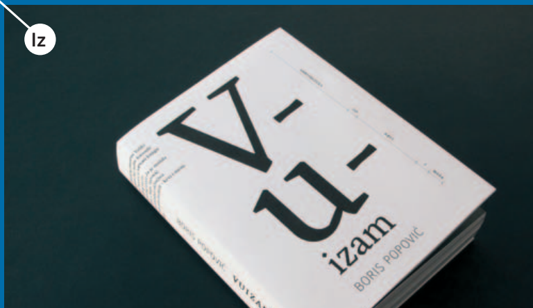
VUIZAM – arhitektura od krvi i mesa, 2011, autor: boris popović za jesenski i turk@preradovičeva 5 i vukotinovičeva 2, http://www.jesenski-turk.hr