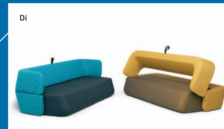
Di REVOLVE, autori: numen for use + bratović&borovnjak, proizvodnja: kvadra/prostoria, http://www.prostoria.hr