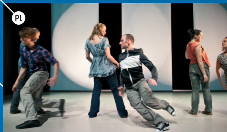
Pl TJEDAN SUVREMENOG PLESA, http://www.danceweekfestival.com