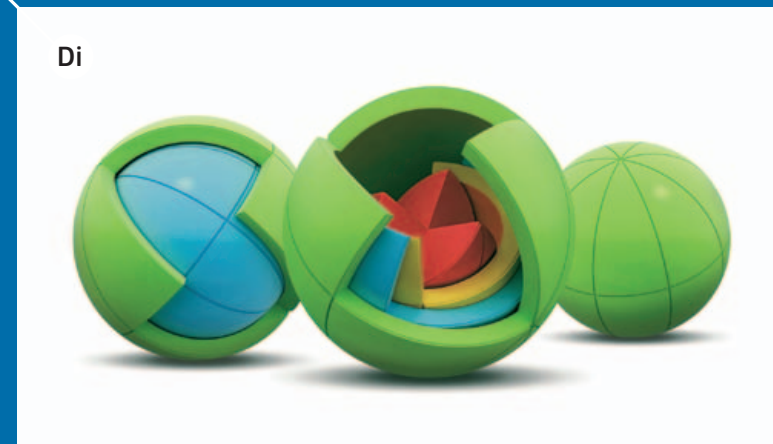
OBLO, 2010, autor: marko pavlović, http://marko-pavlovic.com