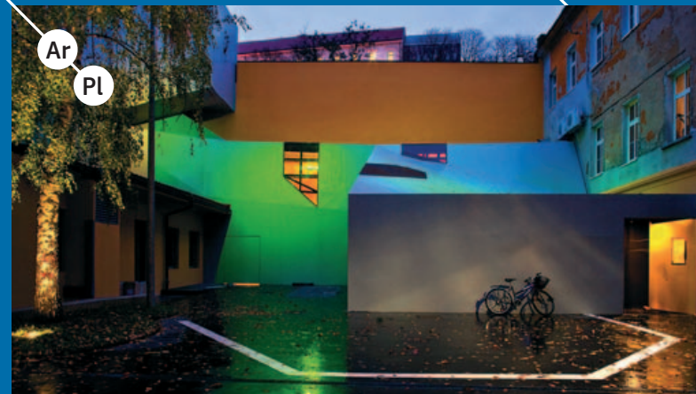
ZAGREBAČKI PLESNI CENTAR@ilica 10, 2009, autori: studio 3LHD, fotografija: miljenko hegedič, http://www.3lhd.com/hr/ , http://www.plesnicentar.info

Ova brošura pokušava dati odgovore na ova pitanja predstavljajući segmente istraživanja o kulturnim i kreativnim industrijama grada Zagreba koja provodi Institut za razvoj i međunarodne odnose. Predstavljeni sadržaj pruža pregled potencijala suvremene kulturne identifikacije grada Zagreba kroz kulturne i kreativne industrije, te upućuje na nova usmjerenja lokalnog razvoja.