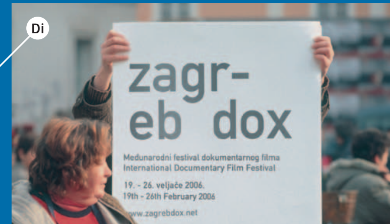
ZAGREBDOX, 2006, autor: damir gamulin, http://www.gamulin.net