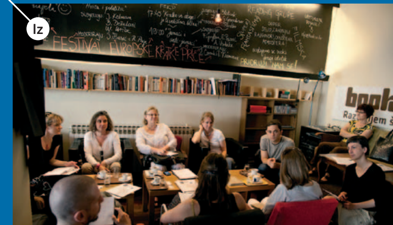
FESTIVAL EUROPSKE KRATKE PRIČE (FEKP), zagreb, http://europeanshortstory.org