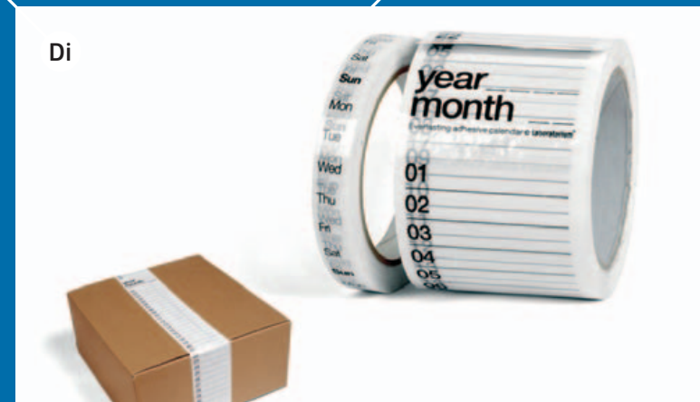
BESKRAJNI KALENDAR, 2007, autor: studio laboratorij/hamper, http://www.hamper.hr