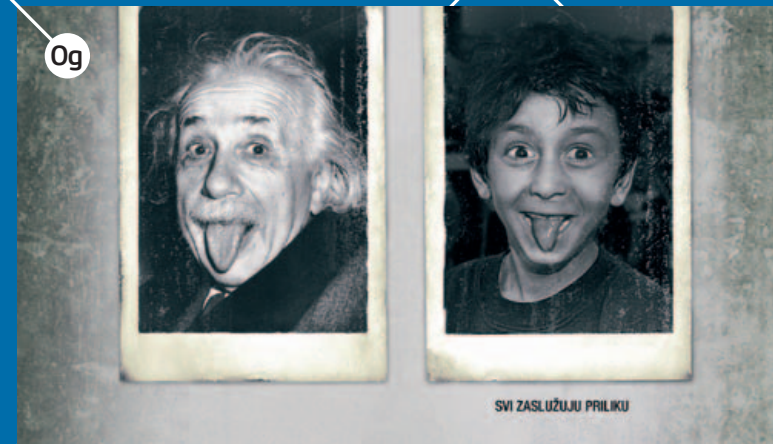
EINSTEIN, autori: mccann zagreb, http://mccann.hr